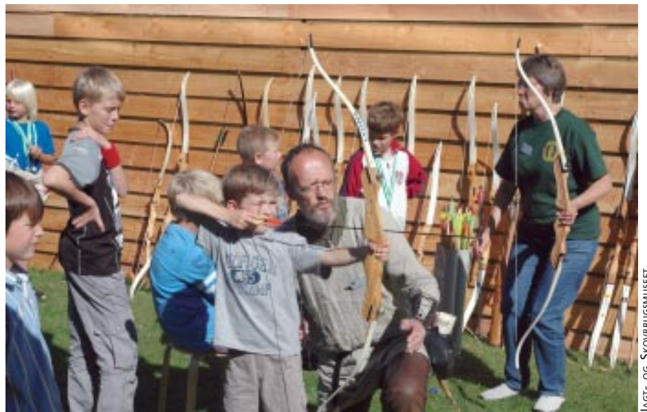
JAGT- OG SKOVBRUGSMUSEET

altid forvaltet vildtet. Og den måde, vi gennem tiden har betragtet og behandlet de store pattedyr i den danske natur på, hænger tæt sammen med, hvilke erhverv, der har været dominerende. Ulvene og vildsvinene blev betragtet som venner af jægere og samlere, men blev til fjender, da menneskene slog sig ned og begyndte at dyrke jorden, for de